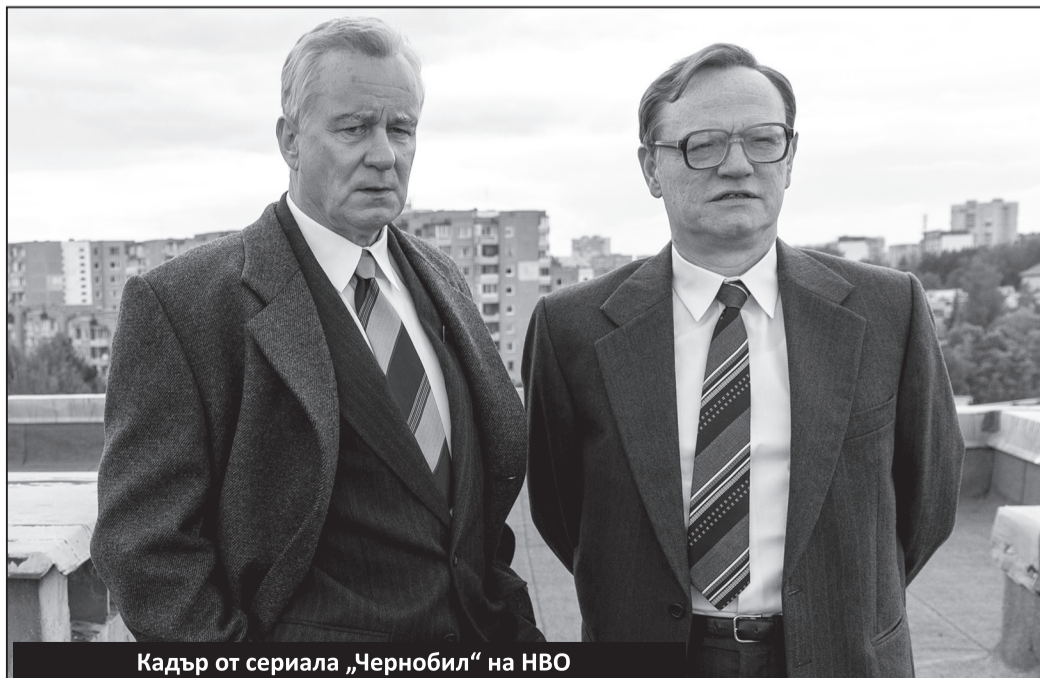
Кадър от сериала „Чернобил“ на НВО