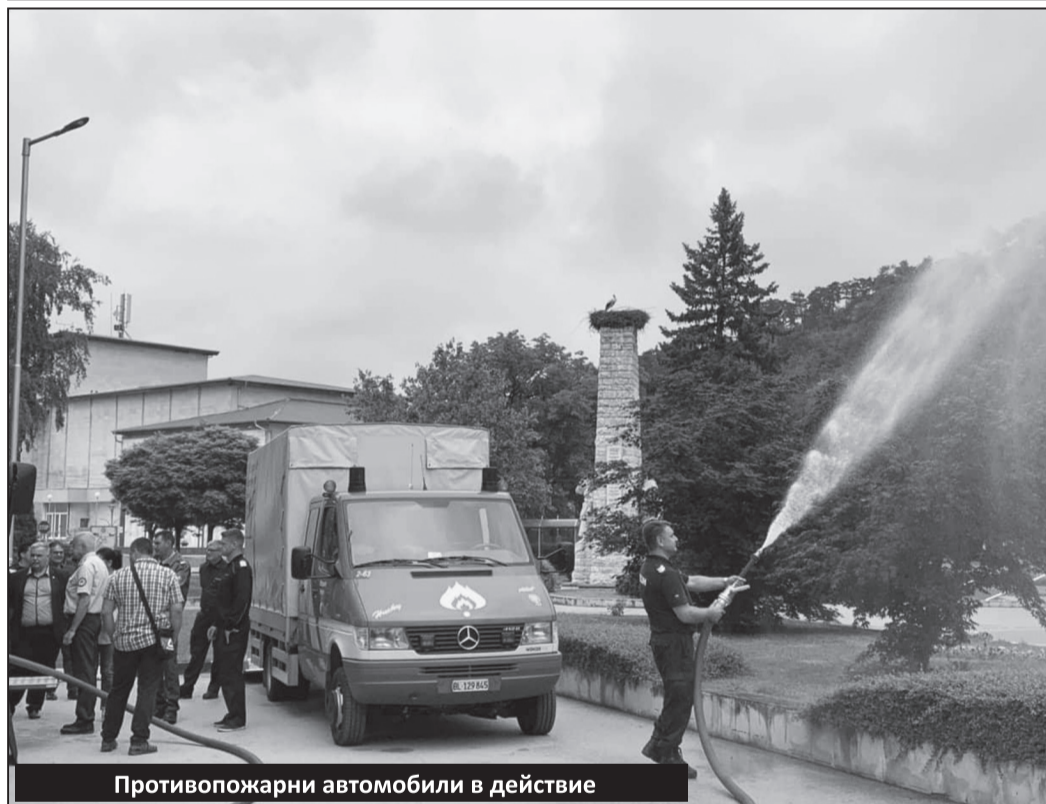
Противопожарни автомобили в действие