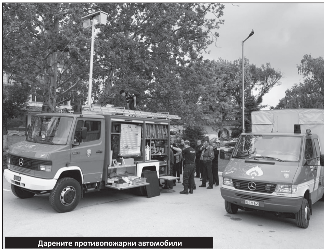
Дарените противопожарни автомобили